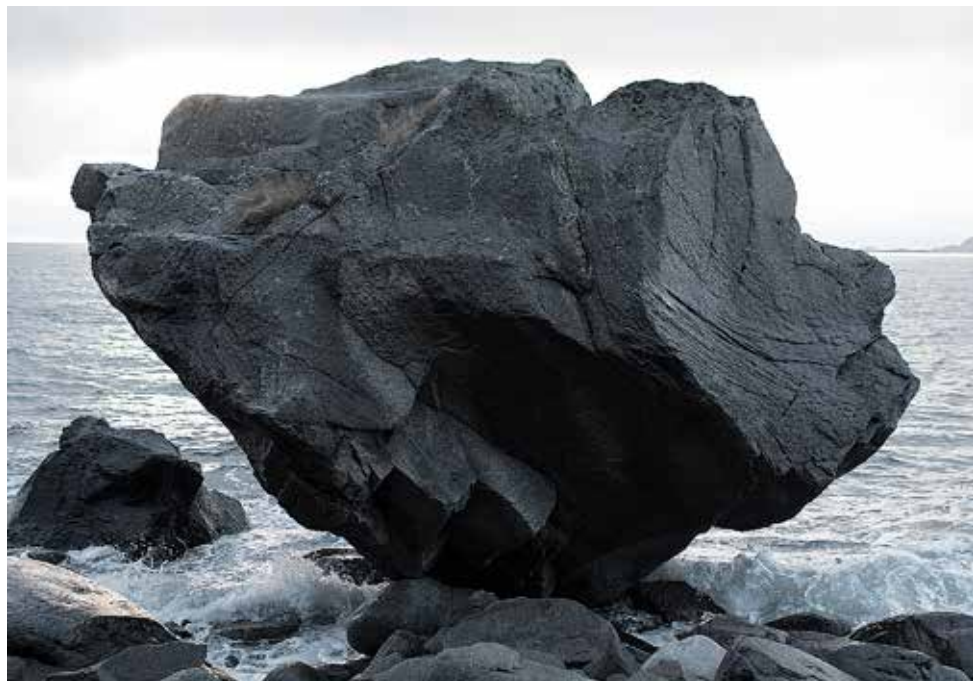
To hold (a stone in my hand), Fotografi Hanna Ljungh, 2017