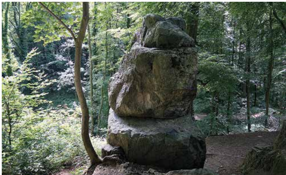
The Society of the Sensitives Fotografi av Goethes sten, Ulrika Sparre 2017