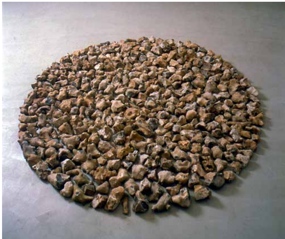
Richard Long, Breaky Botton Flint Circle , 1981 Flintsten (Limhamn). Lån från Malmö Konstmuseum