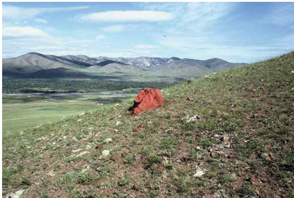
Mountain's Mouth, 2004, Red Mountain, Unduur-Ulaan. I bakgrunden Djingis khans berg, Mongoliet. Målad sten med rött pigment från gruvor i Red Mountain.