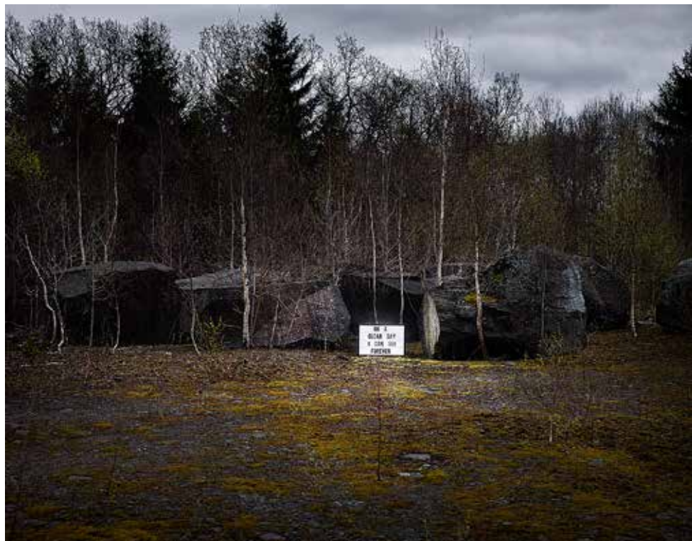
On a clear day I can see forever Svarta bergen, Ulrika Sparre 2015