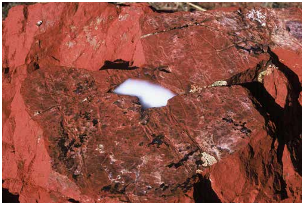
Detalj, Airag (fermenterad hästmjölk) och sten målad med en blandning av rött pigment från gruvor i Unduur Ulaan och hästmjölk.